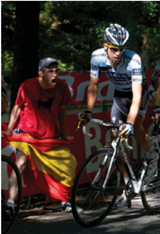
'Contador was een van de hoofdrolspelers in deze Tour. Het licht vind ik hier heel mooi. De emotie van de fan die hem toeschreeuwt maakt het af. Alles komt perfect bij elkaar op deze foto.'

#Tour Leon van Bon won twee etappes in de Tour de France. In 1998 zevierde hij in Pau, twee jaar later won hij de etappe naar Tours. Tegenwoordig werkt hij als fotograaf. Speciaal voor deze krant selecteerde hij zijn mooiste foto's van deze Tour en voorzag ze van commentaar.